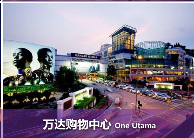
万达购物中心 One Utama