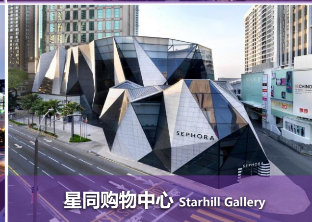
星同购物中心 Starhill Gallery