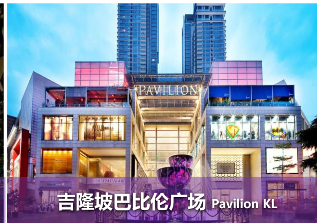
吉隆坡巴比伦广场 Pavilion KL