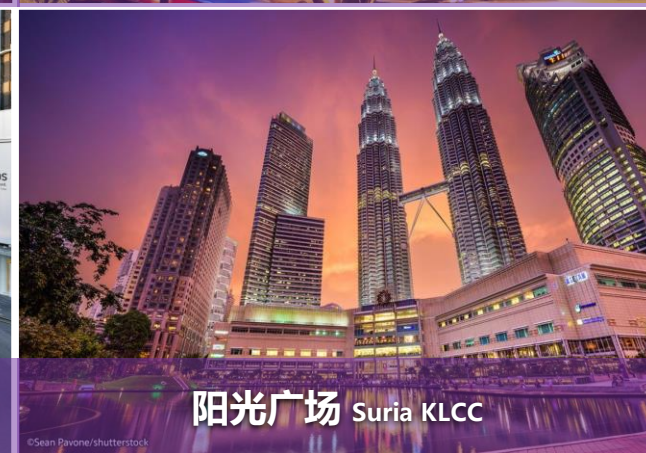
阳光广场 Suria KLCC