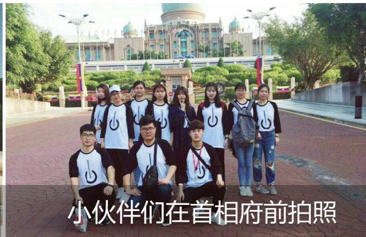
小伙伴们在首相府前拍照