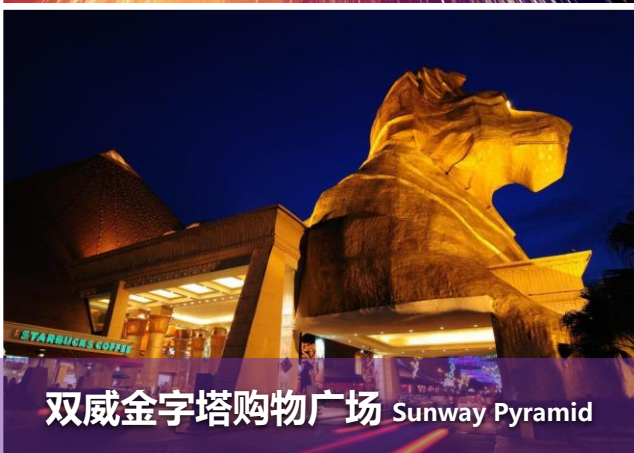
双威金字塔购物广场 Sunway Pyramid