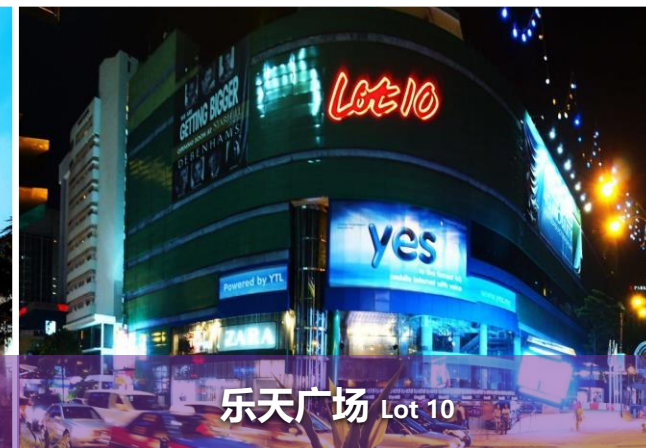
乐天广场 Lot 10