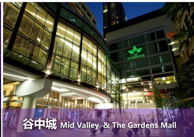
谷中城 Mid Valley & The Gardens Mall